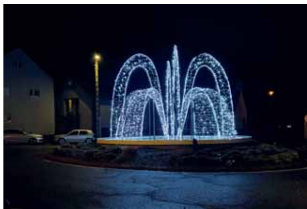
Illumination de Noël

La commune de Luchon a la volonté d'initier des actions en faveur de l'écologie, de l'économie et de la maîtrise de l'énergie dans le domaine de l'éclairage public et des illuminations de Noël.