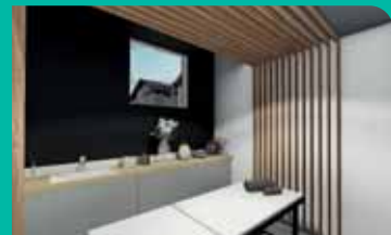
Une offre Spa dans un écrin historique

RHUMATOLOGIE VOIES RESPIRATOIRES ESPACE PRÉMIUM PÔLE THERMOLUDIQUE