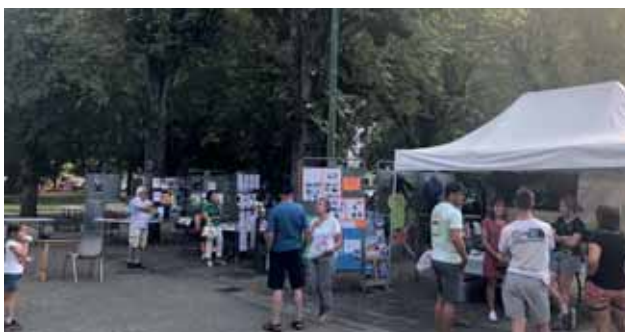
Forum des associations avec de nombreux participants au parc du casino

Encore de belles manifestations se sont tenues en septembre et octobre. Merci à toutes les associations, bénévoles et agents municipaux qui contribuent à l'organisation de tous ces événements.