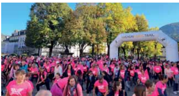
Édition après édition, l'association Elles, attire de plus en plus de monde lors de la marche et de la course en soutien à la lutte contre le cancer pour Octobre Rose.