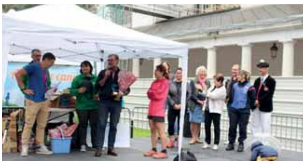
Remise des prix après le trail de l'association Benoît, un sourire pour la vie. En présence du président de l'association, du Maire et des élus du conseil municipal. Une manifestation réussie autour d'une belle cause.