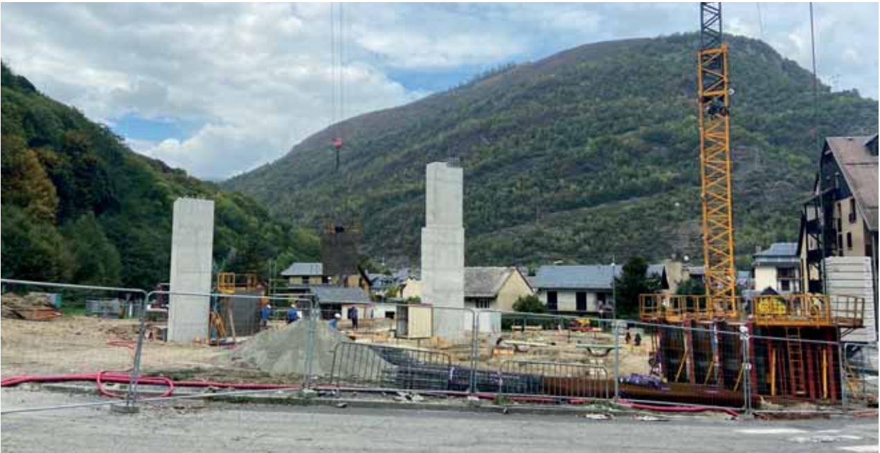
Travaux de la "Crémaillère Express"

les entreprises, de différer l'ouverture de la Crémaillère Express au printemps 2023.