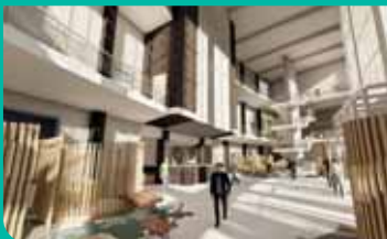
Des espaces soins revisités