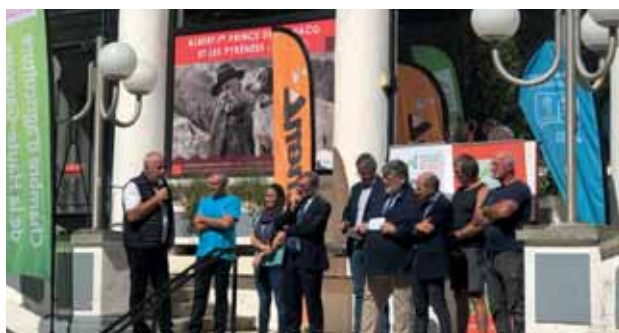
C'est un rendez-vous que les éleveurs du luchonnais ont voulu voir renaitre. Une journée sur le partage et la découverte pour mieux faire découvrir le travail des éleveurs