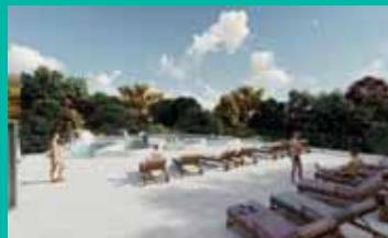
Un nouvel espace thermo-ludique