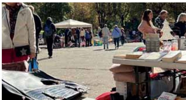
19 e vide grenier de Luchon sous le soleil et avec de nombreux stands et visiteurs