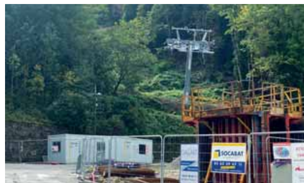
Premier pylône posé au départ de la future "Crémaillère Express"

Ainsi, afin de garantir des conditions optimales de fonctionnement et la sécurité des passagers, le syndicat Haute-Garonne Montagne a décidé, en concertation avec